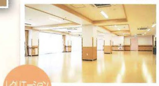
レクリエーションスペース